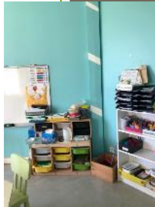
Le matériel à porté de mains