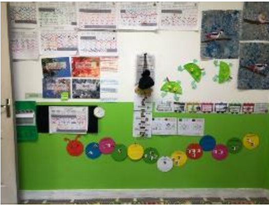
Les rituels du matin