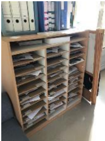
Le rangement des fiches