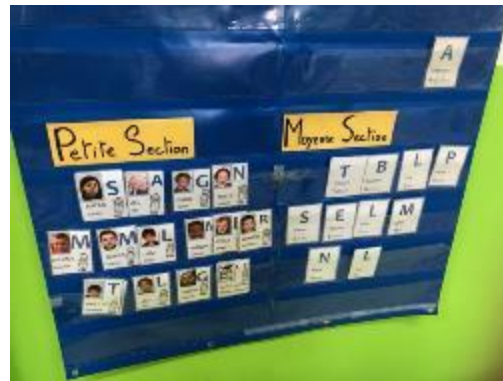
Rituel du matin: l'étiquette prénom