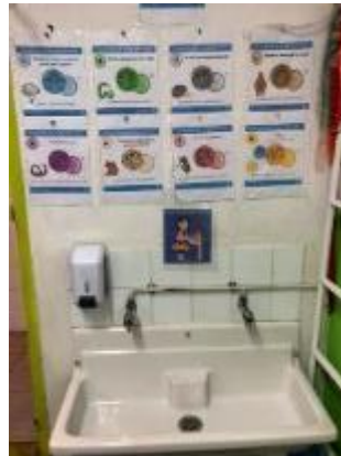
Le lavage des mains